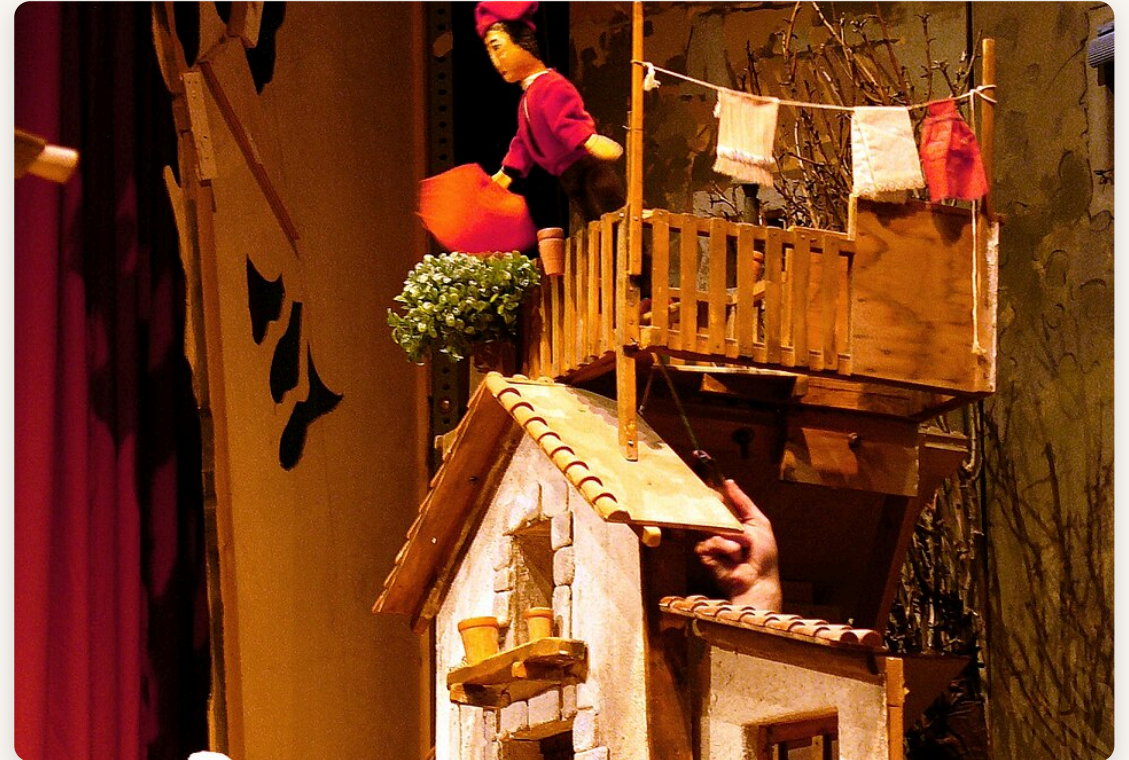
Escena del Betlem de Tirisiti, una de las representaciones más antiguas y singulares del teatro de marionetas en España

Declarado Bien Inmaterial de Interés Cultural por la Generalitat Valenciana el 26 de noviembre de 2002